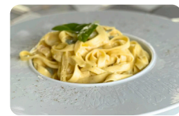
4 FROMAGES 18.00 €