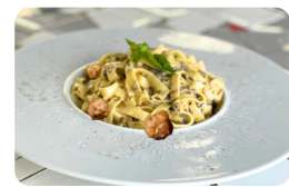
SAUCE POIVRE 18.00 €