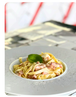
CARBONARA 15.00 €