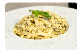
TRUFFES 20.00 €