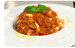
BOLOGNAISE 17.00 €