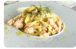
SAUMON 18.00 €