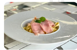
BAMBINO (Beurre, jambon) 12.00 €