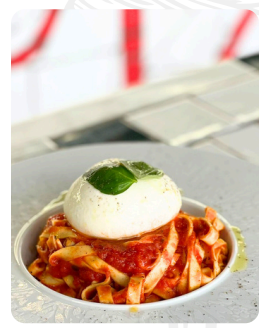
BURRATTA 15.00 €